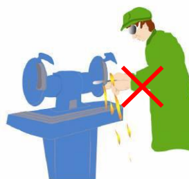
Utilizzo errato della mola